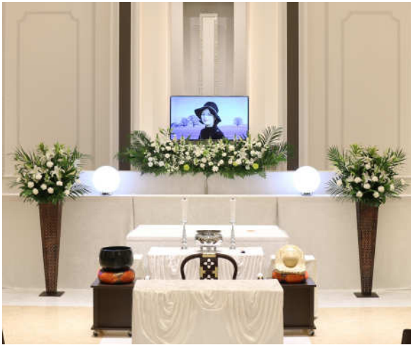
※写真のご供花は別料金となります。